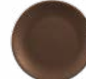
Platos Trinche Zurich De 28 cm. Cerámica. Acabado semi mate.