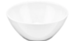
Tazones Soperos Blanco diamante De 14 cm. Elegantes y resistentes a la rotura. No mantiene olores.