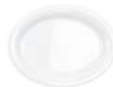
Platos Ovalados Blanco diamante De 35 cm. Resistente a grasas. Ligero y versátil.