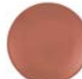
Plato Trinche Pompeya De 28 cm. Cerámica. Acabado semi mate.