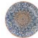
Platos Trinche Alhambra De 27 cm. Porcelana. Acabado brillante.