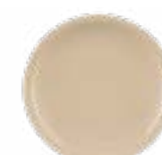
Platos Trinche Arena De 25 cm. Capaz de mantener el calor de los alimentos. Resistente a caídas.