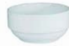
Tazones Soperos Delta De 350 ml. Cerámica. Acabado brillante.