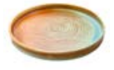
Platos Trinche Coral De 28 cm. Porcelana. Acabado semi mate.