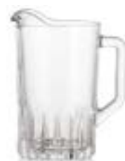
Kristalino Crisa De 1.6 litros. Material de alta calidad, garantizando su durabilidad y transparencia. El vidrio grueso ayuda a mantener la temperatura durante más tiempo.