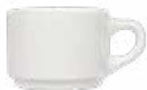
Tazas Embrocables Glacial De 190 ml. Cerámica. Acabado semi mate.