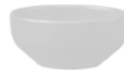
Tazones Soperos Alaska De 350 ml. Cerámica. Acabado semi mate.