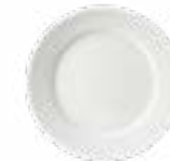
Platos Trinche Elegance De 27 cm. Cerámica. Acabado semi mate.