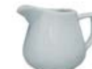
Jarritas Cremeras Delta De 150 y 280 ml. Cerámica. Acabado brillante.