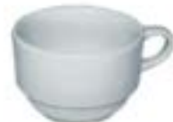
Tazas Café Delta Clásica De 230 ml. Porcelana. Acabado Brilloso.