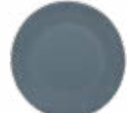
Platos Trinche Chicago De 28 cm. Cerámica. Acabado semi mate.