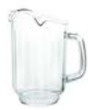
Policarbonato Thunder De 1.9 litros. Con sus tres boquillas permite servir de forma más eficiente. Es resistente a golpes y arañazos.