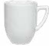
Tarros Capuchino Elegance cuadrada De 300 ml. Porcelana. Acabado semi mate.