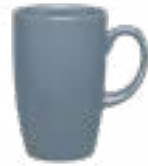
Tarros Chicago De 310 ml. Cerámica. Acabado Semi mate.