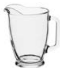
Camelot Crisa De 2 litros. Su material no guarda olores, es reciclable y libre de plomo. Vidrio grueso que garantiza su durabilidad con su buen uso.