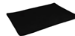
Platos Rectangulares Jet black De 20 cm. Material no tóxico. Apto para lavavajillas.