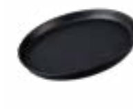
Platos Gourmet Manhattan De 26 cm. Cerámica. Acabado semi mate.