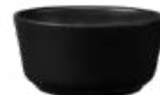
Tazones Cónicos Manhattan De 400 ml. Cerámica. Acabado semi mate.