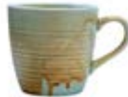
Tarros Coral De 320 ml. Porcelana. Acabado semi mate.