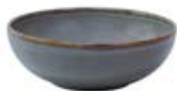
Tazones Panera Tacana De 21 cm. Porcelana. Acabado semi mate.