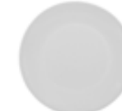
Platos Trinche Alaska De 28 cm. Cerámica. Acabado semi mate.