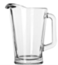
México Crisa De 1.7 litros. Diseño elegante y resistente. Fabricada con vidrio grueso de alta calidad, asegurando durabilidad y resistencia.