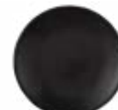
Platos Trinche Manhattan De 28 cm. Cerámica. Acabado semi mate.