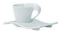
Juego de Taza y Plato Curve De 200 ml. Porcelana. Acabado brillante.