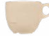
Tazas Arena De 247 ml. Agarradera para evitar derrames. Material resistente.