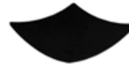
Platos Cuadrados Jet black De 22 cm. Diseño innovador. Fácil limpieza.