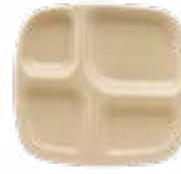
Charolas con División Arena De 28 cm. 4 divisiones. Material durable.