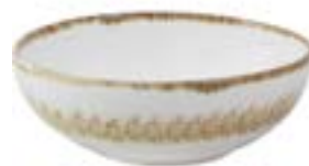
Tazones Panera Artisan De 21 cm. Porcelana. Acabado brillante.