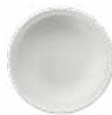
Platos Soperos Madriüeña De 700 ml. Cerámica. Acabado semi mate.