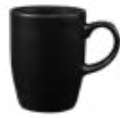
Tarros Manhattan De 310 ml. Cerámica. Acabado semi mate.