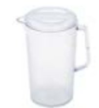
Policarbonato con tapa Tecniplast De 1.9 litros. Tapa de 3 posiciones que permite colar, verter o cerrarse. Material resistente de grado alimenticio.