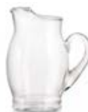
Puerto Vallarta Crisa De 2.5 litros. Modelo tradicional con cuerpo redondeado de gran capacidad. No guarda olores ni sabores.