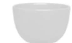
Tazas Consomé Alaska De 220 ml. Cerámica. Acabado semi mate.