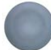
Platos Trinche Denali De 30 cm. Porcelana. Acabado mate.