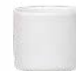
Cremeras Individuales Glacial De 60 ml. Cerámica. Acabado Brillante.