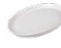
Platos Gourmet Alaska De 26 cm. Cerámica. Acabado semi mate.