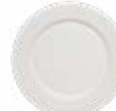
Platos Trinche Glacial De 28 cm. Cerámica. Acabado semi mate.