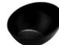
Tazones Inclinados Jet black De 17 cm. Diseño innovador. Calidad y durabilidad incomparable.