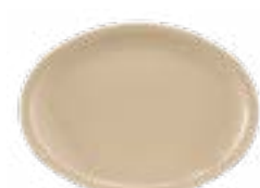
Platones Tampiqueños Arena De 29 x 20 cm. Ligero y resistente. Material no tóxico.