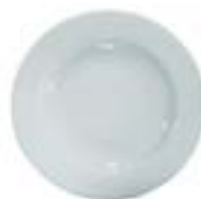
Platos Sopero Delta De 23 cm. Cerámica. Acabado brillante.