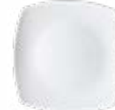
Platos Base Elegance De 29.5 cm. Porcelana. Acabado brillante.