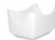
Azucareras Porta Sobres Complementos De 7.5 x 7.5 cm, 11 x 7.5 cm, 12.5 x 7 cm. Porcelana. Acabado Brilloso.