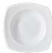
Platos Soperos Elegance De 22 cm. Porcelana. Acabado brillante.