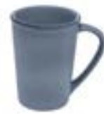
Tazas Cónicas Denali De 350 ml. Porcelana. Acabado mate.