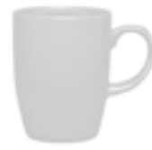
Tarros Alaska De 310 ml. Cerámica. Acabado semi mate.