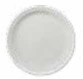
Platos Trinche Madrileña De 24 cm. Cerámica. Acabado semi mate.