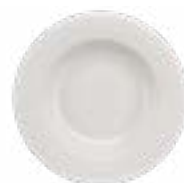
Platos Pasta Bowl Glacial De 31 cm. Cerámica. Acabado semi mate.