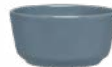
Tazones Cónicos Chicago De 400 ml. Cerámica. Acabado semi mate.