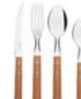
Lámina templada que otorga durabilidad.

Cuchara cafetera, Cuchara sopera, cuchillo mesa y tenedor mesa.