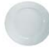
Platos Base Delta De 32 cm. Porcelana. Acabado brillante.