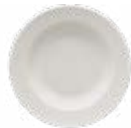
Platos Soperos Glacial De 23 cm. Cerámica. Acabado semi mate.