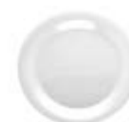
Platos Trinche Blanco diamante De 25 cm. Material durable. Empalmable.